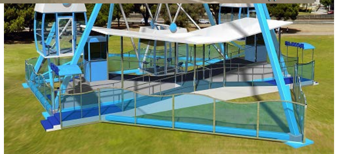
Посадочная платформа колеса обозрения