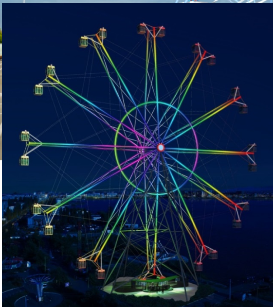
Ночной вид колеса обозрения