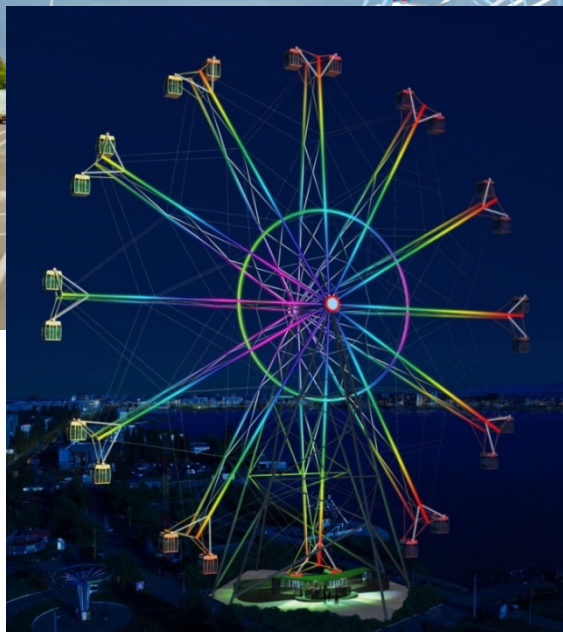
Ночной вид колеса обозрения