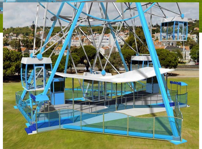
Посадочная платформа колеса обозрения